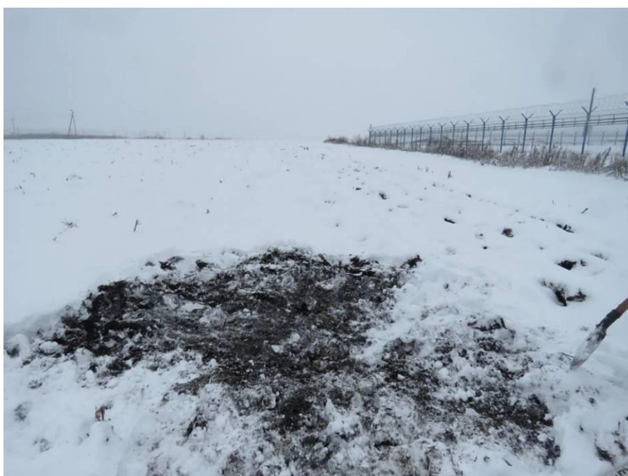
Рис. 15. Шурф № 2. После рекультивации.