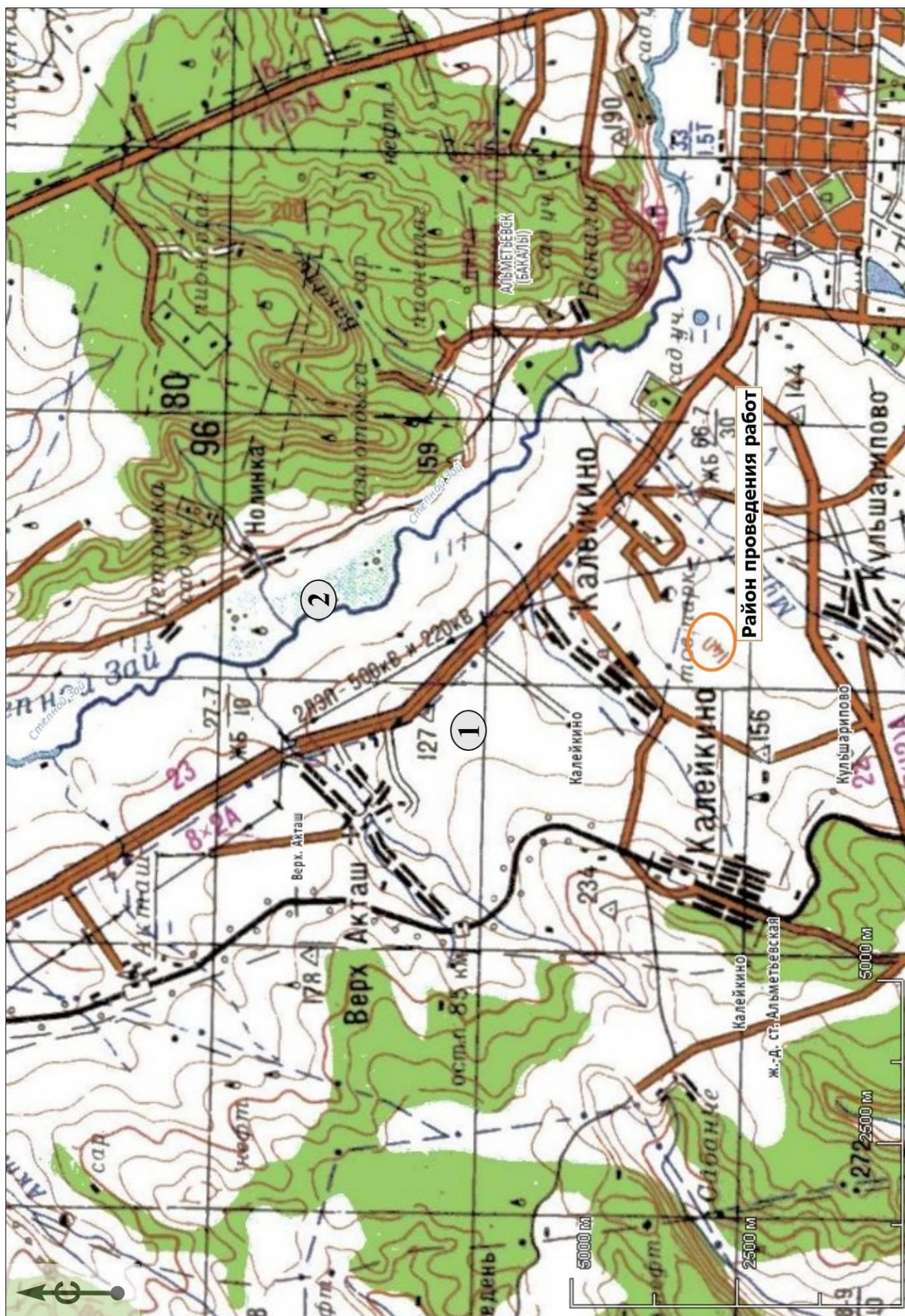
Рис. 2. Район работ по объекту: «ПСП «Шешма-Калейкино» Реконструкция с целью увеличения объема сдаваемой нефти до 4,0 млн. тонн в год» и выявленные памятники археологии: 1 - Верхнеакташская стоянка I, 2 - Верхнеакташская стоянка II.