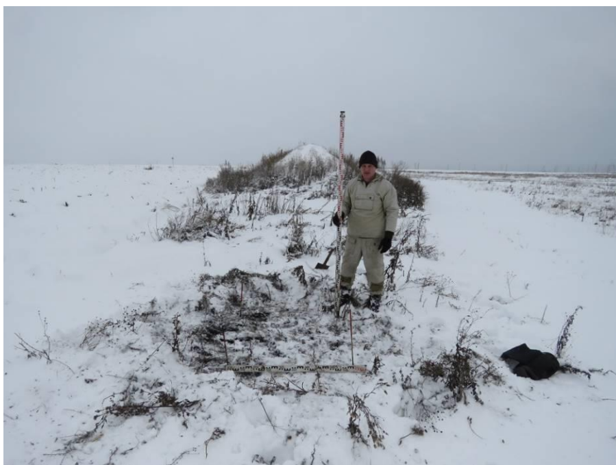
Рис. 10. Шурф № 1. Место заложения и район западной части площадки проектируемого объекта, на распаханной водораздельной поверхности. Вид с юга.