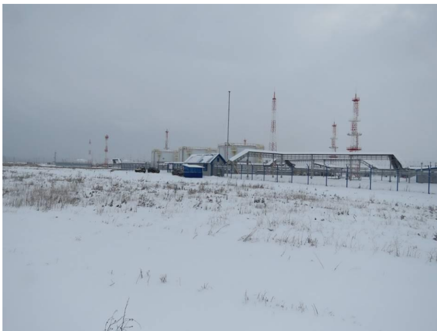
Рис. 5. Типичный ландшафт территории проведения работ по объекту: «ПСП «Шешма-Калейкино» Реконструкция с целью увеличения объема сдаваемой нефти до 4,0 млн. тонн в год». Общий вид с запада на северную часть площадки проектируемого объекта (точка фотофиксации 1).