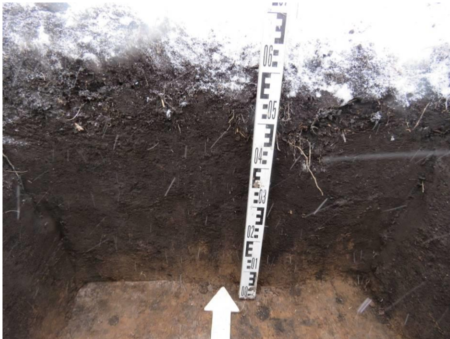
Рис. 17. Шурф № 3. Северная стенка.