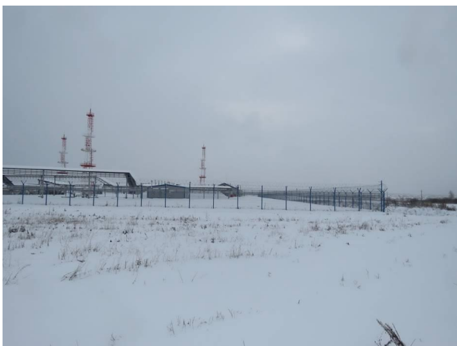
Рис. 6. Типичный ландшафт территории проведения работ по объекту: «ПСП «Шешма-Калейкино» Реконструкция с целью увеличения объема сдаваемой нефти до 4,0 млн. тонн в год». Общий вид с северо-запада на северо-западную часть площадки проектируемого объекта (точка фотофиксации 2).