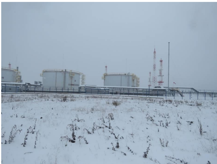
Рис. 8. Типичный ландшафт территории проведения работ по объекту: «ПСП «Шешма-Калейкино» Реконструкция с целью увеличения объема сдаваемой нефти до 4,0 млн. тонн в год». Общий вид с северо-запада на центральную часть площадки проектируемого объекта (точка фотофиксации 4)