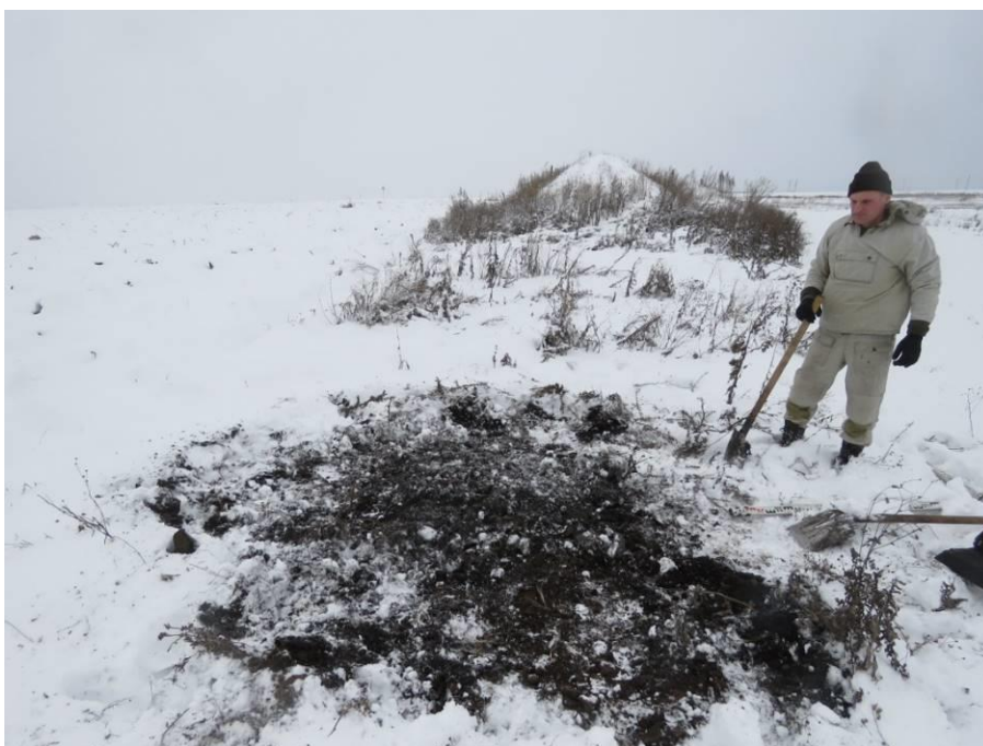
Рис. 12. Шурф № 1. После рекультивации.