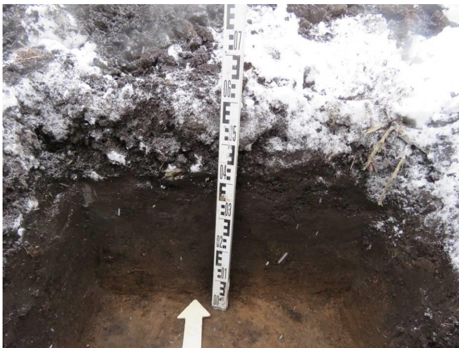
Рис. 14. Шурф № 2. Северная стенка.