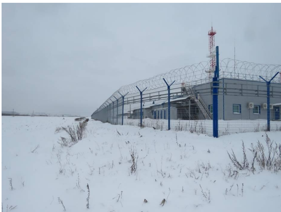
Рис. 7. Типичный ландшафт территории проведения работ по объекту: «ПСП «Шешма-Калейкино» Реконструкция с целью увеличения объема сдаваемой нефти до 4,0 млн. тонн в год». Общий вид с юго-востока на западную часть площадки проектируемого объекта (точка фотофиксации 3)