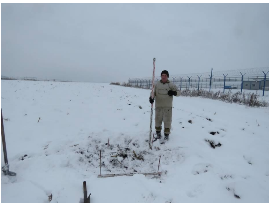
Рис. 13. Шурф № 2. Место заложения и район южной части площадки проектируемого объекта, на распаханной водораздельной поверхности. Вид с юга.