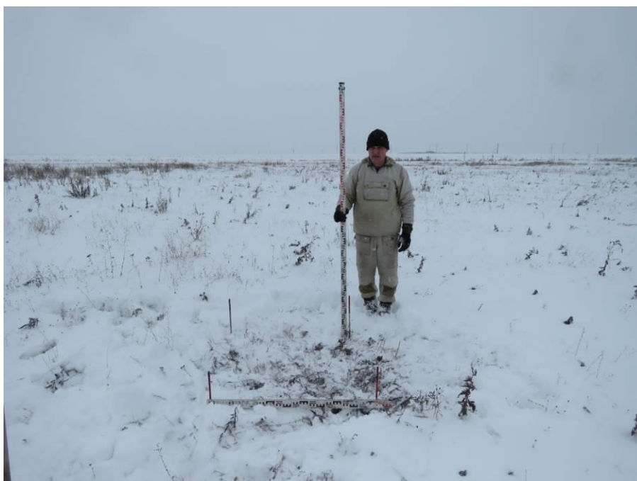
Рис. 16. Шурф № 3. Место заложения и район северо-восточной части площадки проектируемого объекта, на распаханной водораздельной поверхности. Вид с юга.