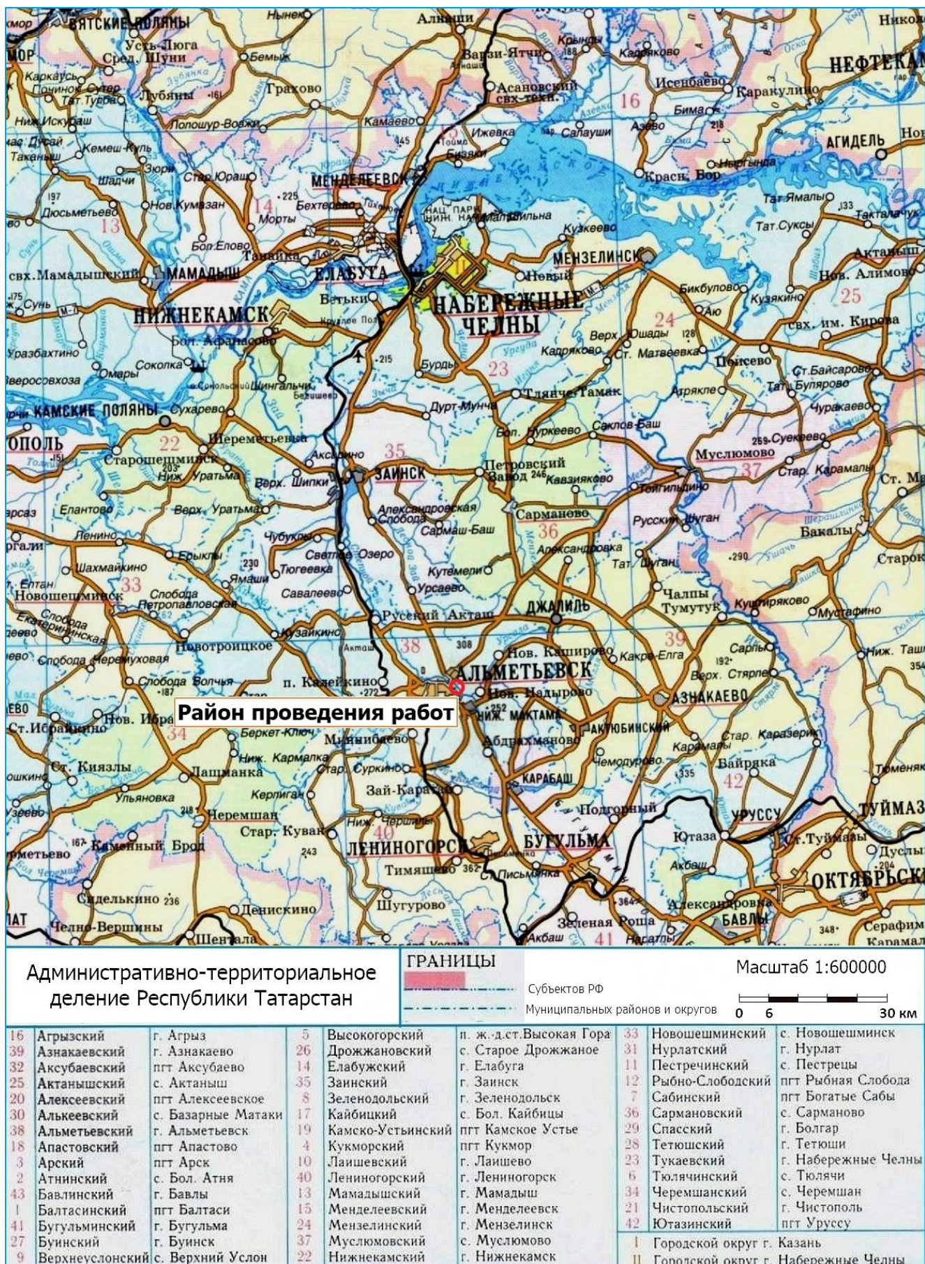
Рис. 1. Район работ по объекту: «ПСП «Шешма-Калейкино» Реконструкция с целью увеличения объема сдаваемой нефти до 4,0 млн. тонн в год» в Альметьевском муниципальном районе (№38) РТ.