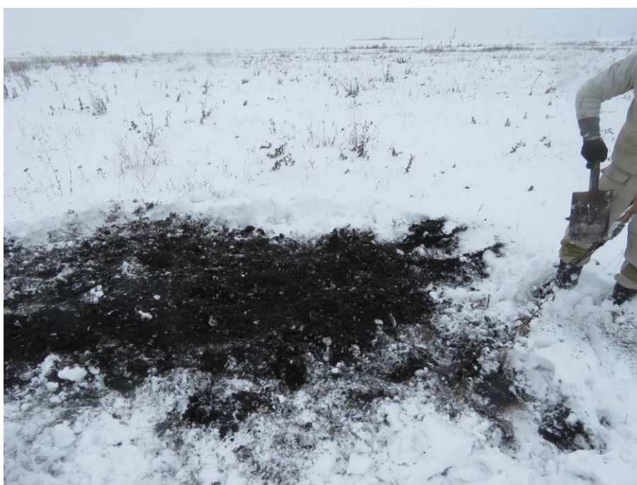
Рис. 18. Шурф № 3. После рекультивации.