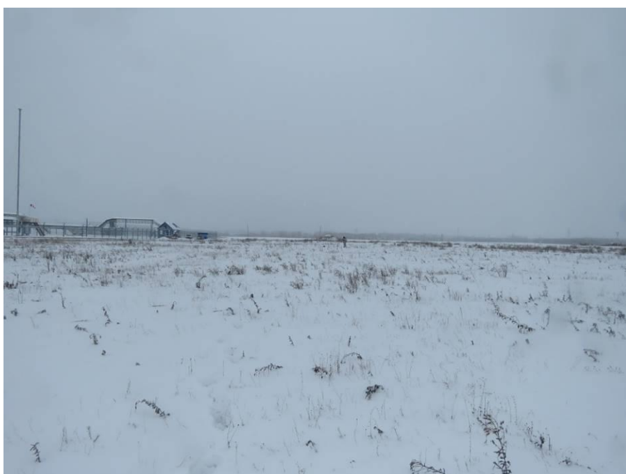
Рис. 9. Типичный ландшафт территории проведения работ по объекту: «ПСП «Шешма-Калейкино» Реконструкция с целью увеличения объема сдаваемой нефти до 4,0 млн. тонн в год». Общий вид с северо-востока на северную часть площадки проектируемого объекта (точка фотофиксации 5).